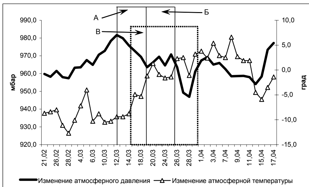
Рис. 3. Динамика атмосферного Д и Т воздуха в период эксперимента. А – период устойчивого снижения атмосферного давления; Б – период устойчивого среднего атмосферного давления; В – период смены температурных режимов.

же с четвертого периода существенных различий в исследуемых показателях между периодами не было. В частности не наблюдалось достоверной разницы исследуемых показателей между периодами резкого возрастания (период VII) и периодами резкого снижения атмосферного Д (период IV).